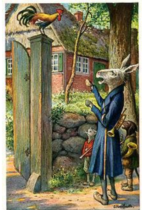
Deutscher Grimm Die Bremer Stadtmusikanten © Gerrit van der Pijl